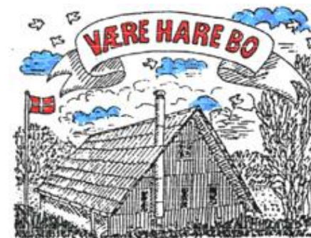
Spejderhytten Væreharebo Hove Møllevej 18 2765 Smørum

DET DANSKE SPEJDERKORPS vaereharebo@erik-harefod.dk www.erik-harefod.dk